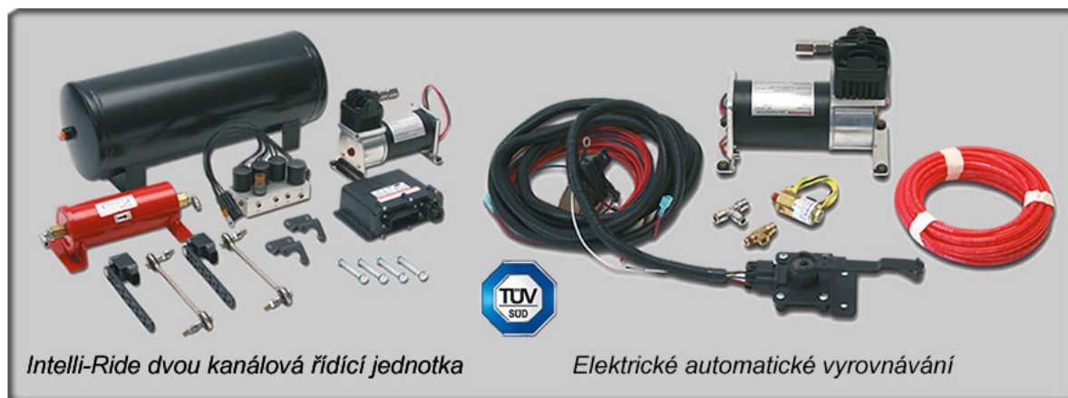
Intelli-Ride dvou kanálová řídicí jednotka

V neposlední řadě systém Full Air VW T5 od společnosti Goldschmitt posunul hranici maximálního možného zatížení VW T5 z 3,2 t na 3,5 t. Ve spolupráci se společností FD servis Praha, s.r.o. se podařilo tento špičkový výrobek homologovat a zajistit možnost zápisu do TP i v České republice.